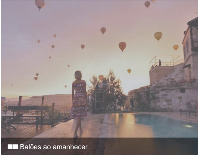
■ ■ Balões ao amanhecer