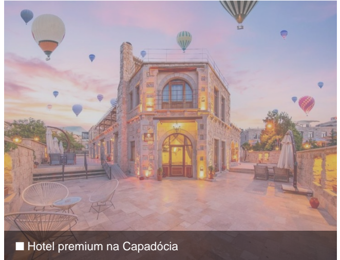
■ Hotel premium na Capadócia

A Capadócia é uma das regiões mais icônicas do mundo, conhecida por suas formações rochosas únicas e paisagens surreais que parecem de outro planeta. Uma experiência que muda quem visita.